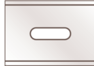
INDUSTRIAL BLADE NO. 92

Die Klingen werden in einem Beutel (10 St.) geliefert.