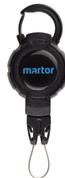
MARTOR TOOL RETRACTOR 9960

Der TOOL RETRACTOR schützt Ihr Schneidwerkzeug vor Verlust und vor dem Herunterfallen. Kernstück ist die hochbelastbare und bis zu 90 cm ausziehbare Kevlarschnur. Sobald Sie Ihr Messer loslassen, wird es über die flexible Schnur zu Ihnen zurückbefördert. Ihre Hände sind frei für andere Tätigkeiten – das Messer bleibt stets griffbereit. Der Karabiner ist für Ihre Gürtelschlaufe gedacht, das Stahlseil am anderen Ende für die Öse Ihres Schneidwerkzeugs.