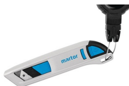
Für viele Messer

Um Ihr MARTOR-Messer zu befestigen, nehmen Sie das Endstück ab. Die Schlaufe aus Stahlseil können Sie jetzt deutlich leichter öffnen und wieder schließen. Hängt das Messer dran, klicken Sie das Endstück wieder ein. Fertig!