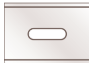
Industrial blade nr 192